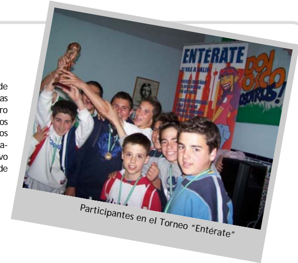
Participantes en el Torneo "Entérate"

Fue un auténtico día de puertas abiertas para los y las jóvenes de Utrera y alrededores. Durante toda la jornada se disputaron dos ligas de fútbol con la participación de más de veinte equipos. El dinero recaudado a través de las inscripciones fue destinado a los proyectos de alfabetización de la ONGD Manos Unidas. Además del deporte, los más pequeños disfrutaron de múltiples talleres (manualidades, maquillaje, peluquería, arcilla...) y pudieron visitar el Stand informativo de la Campaña "Entérate" que estuvo muy concurrido a lo largo de todo el día.