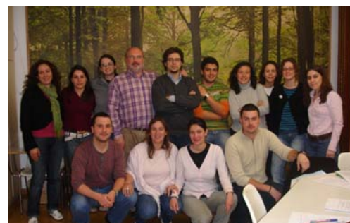
Técnicos y técnicas de las Federaciones y Confederación en el curso "Gestión de proyectos orientada a resultados"

La 9ª Escuela de formación se estrenó el pasado jueves día 15 de marzo, en Valencia. Los técnicos y técnicas de federaciones y confederación tuvieron una sesión formativa "Gestión de proyectos orientada a resultados", en el marco de una reunión de coordinación. Además de la formación y los temas de trabajo, también disfrutaron de la fiesta valenciana de las Fallas.