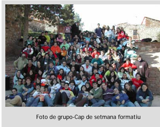
Foto de grupo-Cap de setmana formatiu